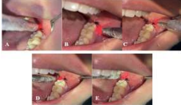
Hình 1. Các vị trí chiếu laser xung quanh ổ răng

cho mỗi vị trí. Trong quá trình chiếu laser, bệnh nhân và bác sĩ được đeo kính bảo hộ phù hợp, đầu chiếu chỉ được kích hoạt khi đã đặt vào đúng vị trí trong miệng.