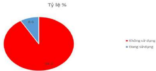
Hình 1: Sử dụng dịch vụ PrEP

Bảng 2 cho thấy, 36,3% đối tượng chưa từng xét nghiệm HIV. 10,5% đối tượng từng xét nghiệm HIV từ trên 12 tháng.